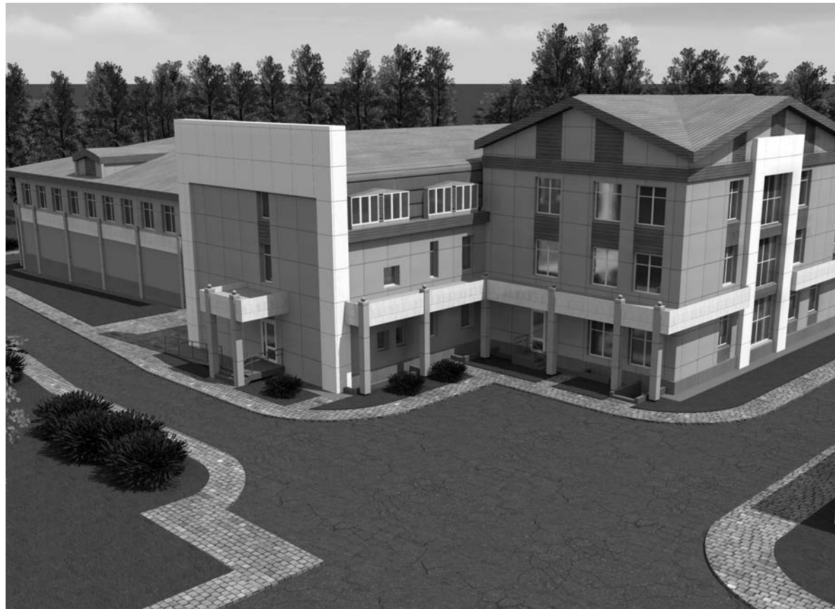
Новый межрайонный медицинский центр будет соседствовать с ГБ-2 и областным онкодиспансером, что позволяет уже говорить о создании больничного городка.

Братчане смогут получать консультации высококвали-